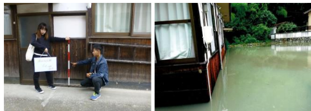
写真-1 DIG(上)・防災まち歩き(下)の状況