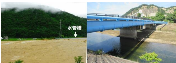
写真3 黒瀬川の洪水時(7/7 10時)と通常時の水位の比較

【黒瀬川】黒瀬川のピーク水位は7月6日23時にTP4.02mまた7月7日8時にTP4.42mであり、堤頂天端近くまで達し危うく越流を生じる危険な状態であった(写真3)。