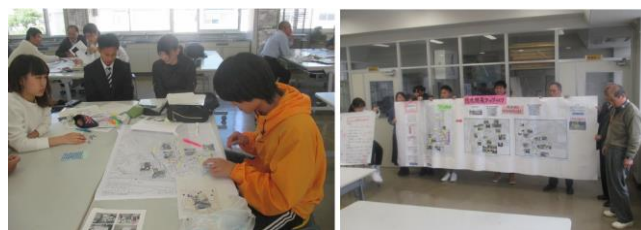
写真2 防災まち歩きの整理と課題の発表