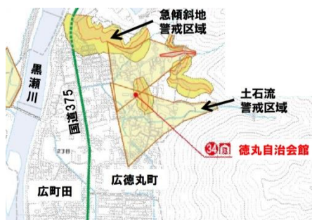
図-1 広徳丸地区と土砂災害警戒区域

室内でのDIGでは地形図上に①地形・道路・川・地域の施設等を色塗りし、まちのつくりを知る。次に②ハザードマップ(土砂災害、洪水浸水等)や地元からの過去災害履歴情報を記入し、地域の「強み」「弱み」や災害に関する課