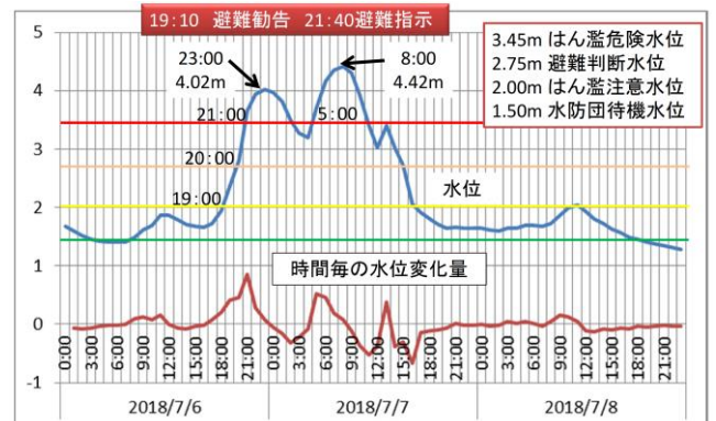
図-4 黒瀬川町田水位観測所の水位データ (H30.7.6~7.8)

図-4は町田水位観測所のデータである。呉市では7月6日の15時ころまでは10mm/h以下の状態が継続し水防団待機水位が継続していた(累積雨量約280mm)。15時ころより雨量強度は増加し、黒瀬川の水位も上昇し19時にははん濫注意水位(避難勧告19:10)、20時に避難判断水位、21時にははん濫危険水位を超え(避難指示21:40)、23時に1回目のピーク水位4.02mを記録した。その後2回目のピーク水位は7月7日8時の4.42mであった。避難勧告発令時にはすでに徳丸地内には内水はん濫が生じており、図-2に示した外水はん濫に至らずとも避難遅れの状況であり、当該地域における避難の判断基準の構築が課題と考えられる。